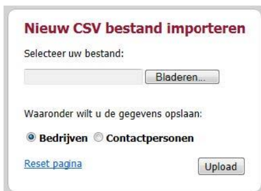
Figuur 1: Scherm nieuw CSV bestand importeren

U begint door een CSV bestand te uploaden.